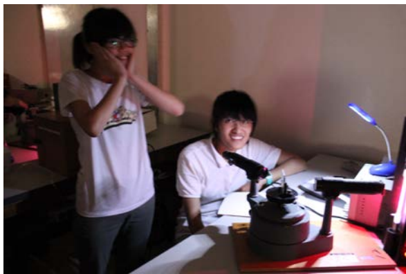
圖 9：學員們成功找到線光譜開心不已