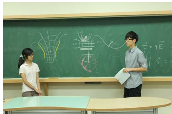
圖 10：學員們分享成功畫出電場分布