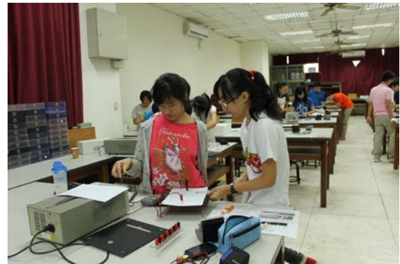
圖 6：學員們自製等電位圖