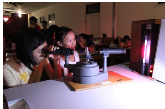
圖 8：學員們實際觀察氫原子放光現象