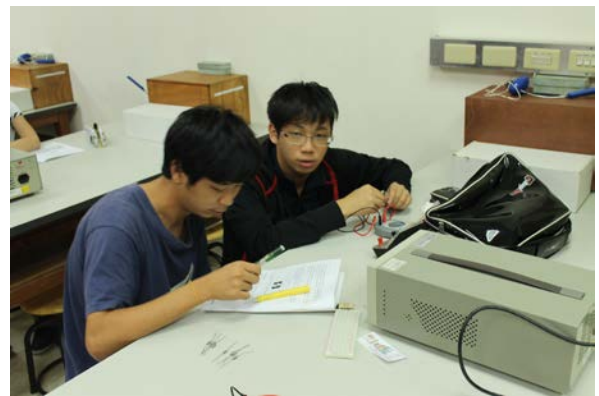
圖 2：學員們思考如何串聯安培計