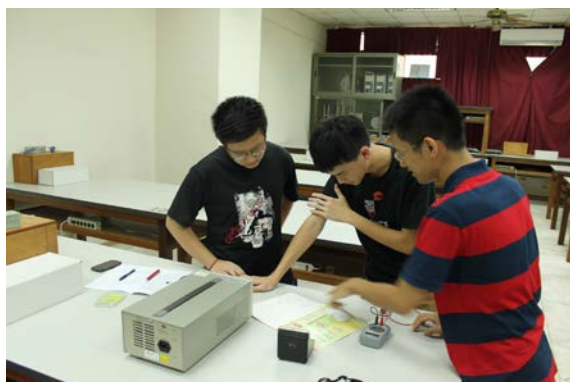
圖 3：助教與學員討論並檢視線路圖