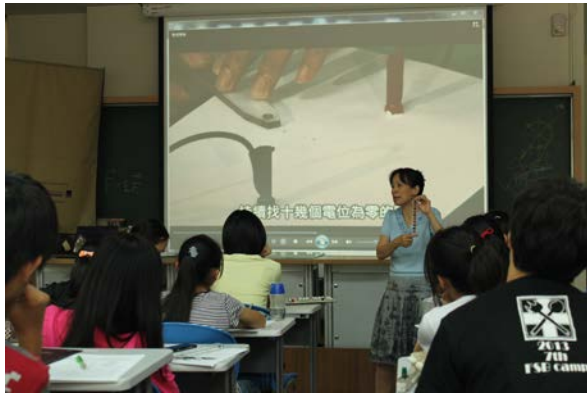
圖 5：戴教授說明電場的測量方式